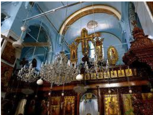
Fra en af de mange kirker i Sednaya, som var et yndet turistmål—også for danske turister.

Endnu en aramæisk talende by – aramæisk er det samme sprog, som blev talt på Jesu tid – er blevet overfaldet af muslimske jihadister, meddelte Vatikanets nyhedsbureau FIDES.