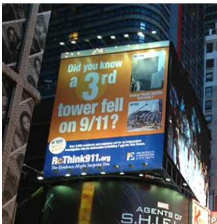
Amerikanske skeptikere i ”Re-think 11/9” sætter plakater op i byerne. Men mange følges på forskellig vis.

Bedømmelsen af sandhedsindholdet i dem overlader vi læserne selv.