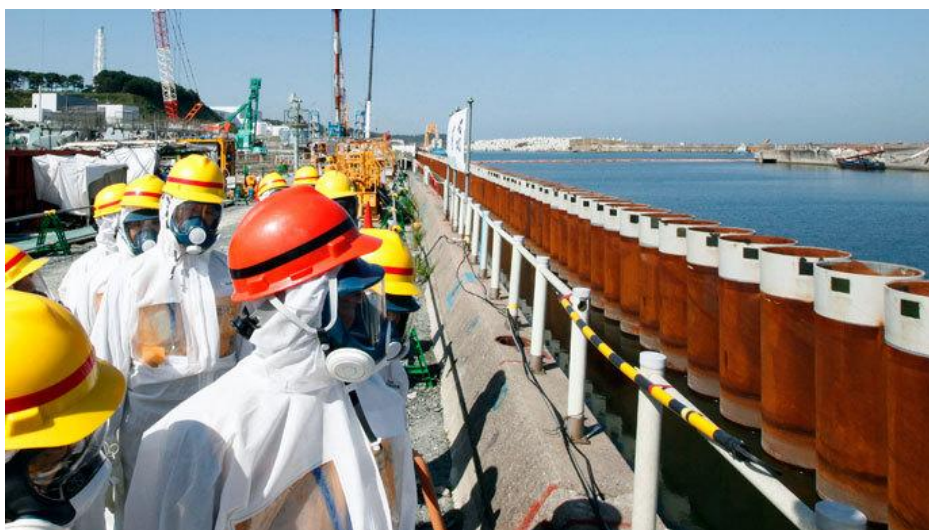
Den japanske premierminister med rød hjelm og iført beskyttelsesmaske og -dragt, besøgte værket dem 19. september.

Den farlige fjernelse af brændselsstavene ved det havarerende atomkraftværk i Fukushima skal efter planen først finde sted i november.