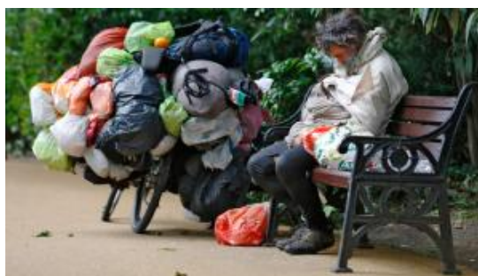
Sulten banker på i Storbritannien.

Ifølge den britiske regerings officielle tal lever 3,5 millioner britiske børn – hvilket vil sige hvert fjerde barn – under fattigdomsgrensen. Problemet er blevet værre efter, at den britiske regering i marts skar