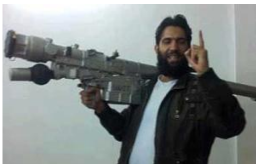
Rebellerne har dog længe haft anti-tank-missiler. Dette billede er fra 2012.

Planen om at træne og bevæbne moderate rebeller via Syriens sydlige grænser vandt vestlig og saudisk støtte tidligere dette år, efter at bekymringerne voksede over erobringer fra Assads styrker, hjulpet af hans libanesiske støtte Hizbollah, såvel som over fremgangen for de islamistiske rebelbrigader.