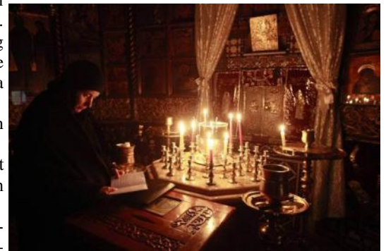
Fra et nonnekloster.

For at forsvare sig er de kristne, som udgør 10 procent af den syriske befolkning, nu begyndt at slutte sig til de væbnede forsvarsstyrker, som med våben fra regeringen gør det muligt for dem at forsvare deres egne områder.