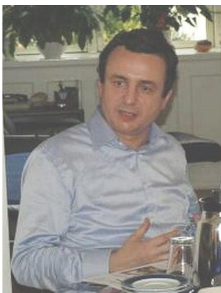
Albin Kurti på besøg hos STS i Roskilde i juni 2012.

Der skal være kommunevalg i Kosova den 3. november og vores venner i Vetevendosje gør sig klar til at fortsætte kampen imod neoliberalismen også ved denne lejlighed.