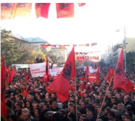
Fra demonstration forud for parlamentsvalget i 2010

Den 10. september fik Vetevendosje besøg af den nye albanske premierminister, Edi Rama, og andre repræsentanter for Albanien. Under et møde drøftede man blandt andet albanernes situation, og muligheden for et nærmere samarbejde mellem den albanske republik og Vetevendosje fra Kosova.